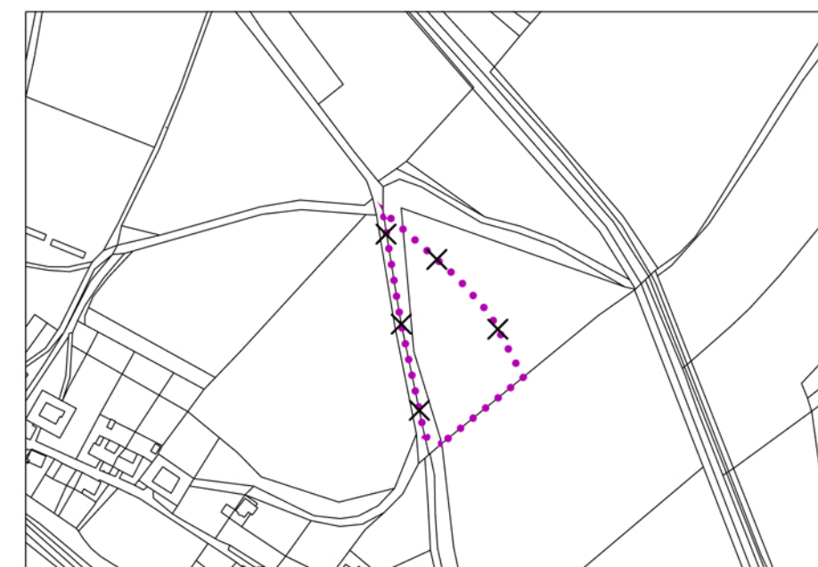
VÝŘEZ VÝKRESU B